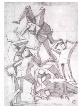
Fig. 1. Composición de líneas La complejidad del dibujo viene dada por la combinación de líneas que se entrecruzan para formar una estructura.